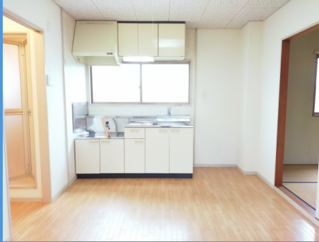
※図面と現況が異なる場合は現況を優先いたします。