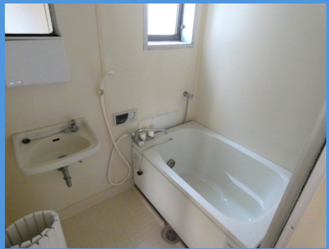
※図面と現況が異なる場合は現況を優先いたします。